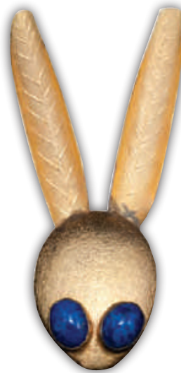
Broșă primită de Majestatea Sa de la bunica maternă, Prințesa Margareta a Danemarcei.

Având o viziune strategică și un simț al diplomației unice, Regina Maria a influențat prin faptele sale destinul istoric al României. Misiunea sa oficială de la Paris, prin care a sprijinit negocierile din timpul Conferinței de Pace de după Primul Război Mondial, a avut un rezultat excepțional din punct de vedere politic – formarea României Mari. Ca și predecesoarea sa, Regina Maria a îngrijit