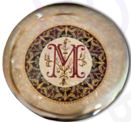
Prespapier aflat pe biroul Majestății Sale.

universitare, cât și după, Majestatea Sa Margareta a arătat o preocupare intensă pentru domeniul social, continuând astfel acțiunile inițiate de Elisabeta, Maria și Elena.